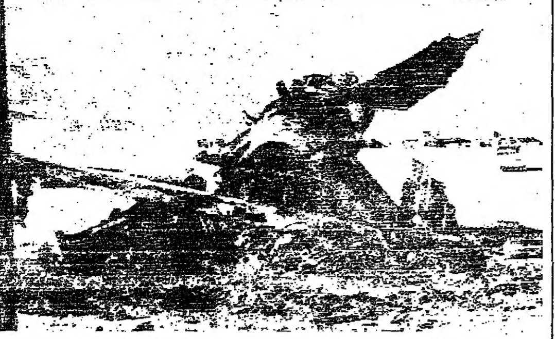
ملحاً طائرة تابعة ل سلاح الجو الامريكى من طراز (ف - ١١١) - أي تطهت واضرقت ، وتكن ملحاها من قنف نفيها لمقاة قبل تطهها بالقرب من لاس فيغاس ، يوم الاثنين الماضي. وكانت الطائرة في طريق عودتها إلى قاعدتها من رحلة تدريبية روتينية . وقد تحطت حتى الآن أكثر من تسع طائرات من هذا الطراز

CHINA NATIONAL CHEMICALS IMPORT & EXPORT CORPORATION SHANGHAI BRANCH الموزعون الوحيدون في الأردن وكالة سلطانين للتوكيمسيون عمان - هاتف ٤١٥٧٦ ص. ب ٤٧٣